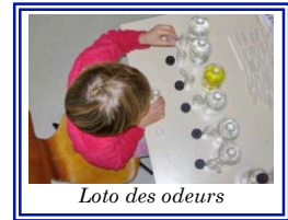
Loto des odeurs

La journée en question s'est déroulée à l'Hôpital des Enfants de Genève le 18 octobre dernier. Les employés de la firme ont patiemment dévoilé leur savoir-faire aux enfants hospitalisés des différents services, en créant avec eux des parfums et en jouant à un loto des odeurs. La journée a remporté un grand succès. Les jeunes enfants furent ravis de connaître le monde des senteurs avec des vrais professionnels qui se sont montrés très attentifs durant tout l'après-midi.